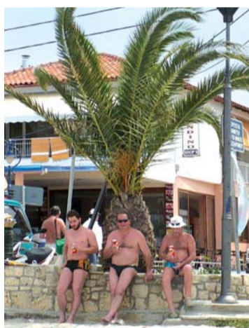
Z dovolené v Řecku...

Naopak zůstaly příspěvky na narozené děti (letos na 11 dětí v cel-