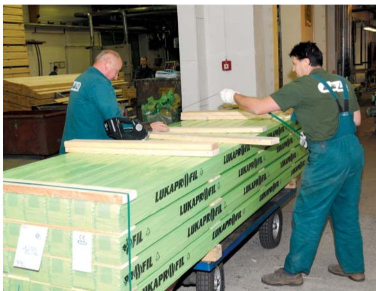
Díky novým zákazníkům a oživení poptávky po hoblovaném zboží jsme mohli obnovit nepřetržitý provoz na pilnici, palubkárně a manipulaci.

Jednotliví pracovníci družstva, zejména vedoucí, mají při rozhodování vysokou míru volnosti. Od každého proto očekáváme aktivní hledání možností a způsobů,