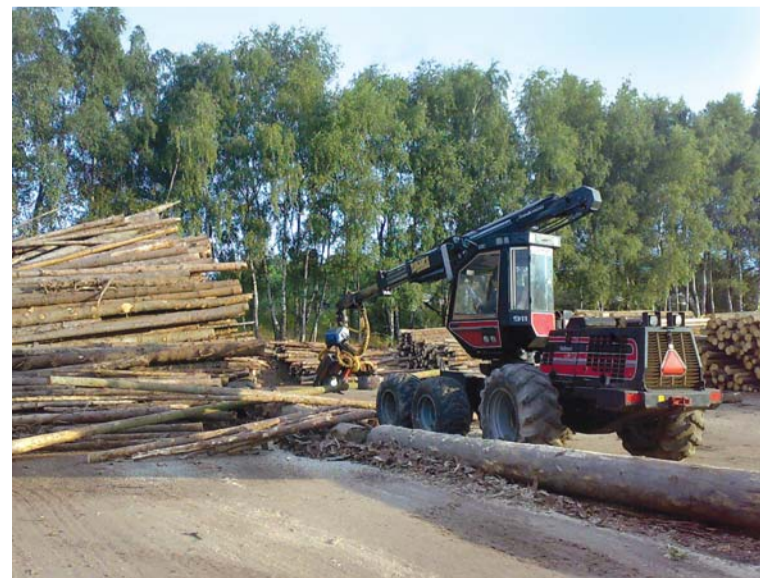
S manipulací surových kmenů nám pomáhá zapůjčený „harvestor“.