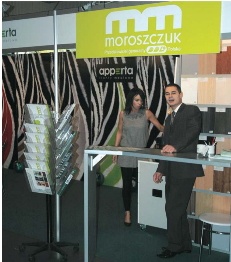
Náš zákazník úspěšně prezentoval výrobky DDL.