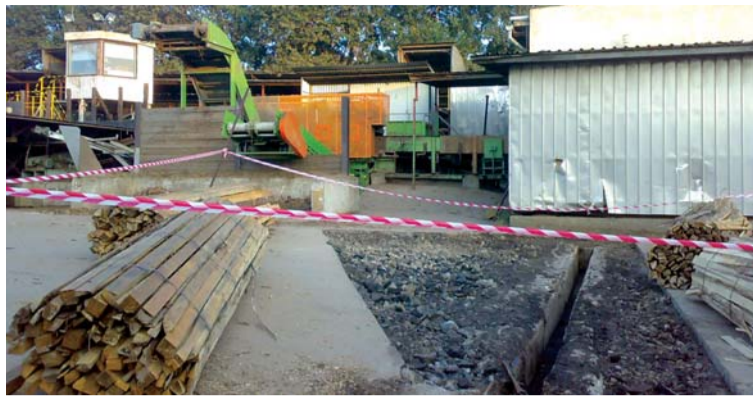
Oprava komunikace u sekaček.

Při této opravě byla odstraněna konstrukční chyba, která způsobovala výpadek lisu v desítkách hodin. Na kotelně MDF došlo